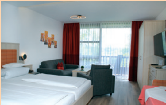
Typ 1 - Der Klassiker

*Als Zusatzbett dient die bequeme Wohnzimmercouch.