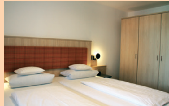
Typ 3 - Das Charmante

Unsere neuen Betten haben wir natürlich in Komforthöhe bauen und mit hochwertigen Matratzen ausstatten lassen. Die Lattenroste kann man im Kopf- und Fußbereich verstellen. Alle neuen Bäder sind mit Dusche/WC ausgestattet und verfügen über einen elektrischen Handtuchtrockner und Fön.