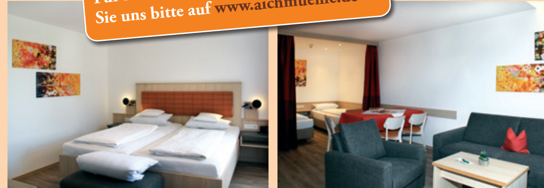
Typ 4 - Das Elegante

Für noch mehr Impressionen besuchen Sie uns bitte auf www.aichmuehle.de